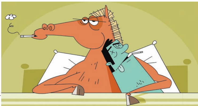
איור: עיר מנדל