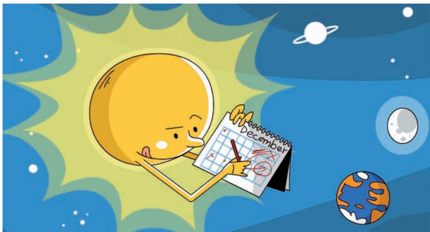
איור: ערן תנדל