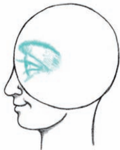
מתבונן על העולם החדש