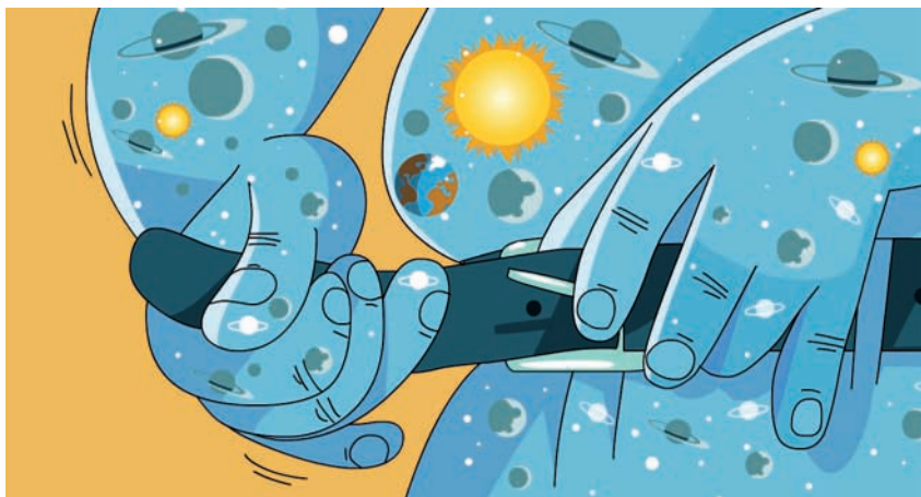
איור: ערן מנדל