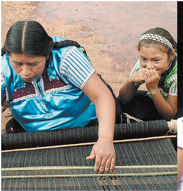
מוחמד יונס, הוגה השיטה (מימין), ולקוחות מיקרופיינס בעסקים שפתחו בזכות ההלוואות: בעלת סדנת תיקונים בגאנז, חופרת במקסיקו ואופות במקסיקו. רוב הלקוחות הן נשים, משקיעות כמעט 90% מרוויחין בבריאות חינוך