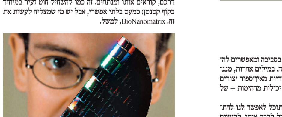
הפנטסמיה כפיתוח הגנטי פופולריים, שממפים במדיקת סליק שנים של DNA