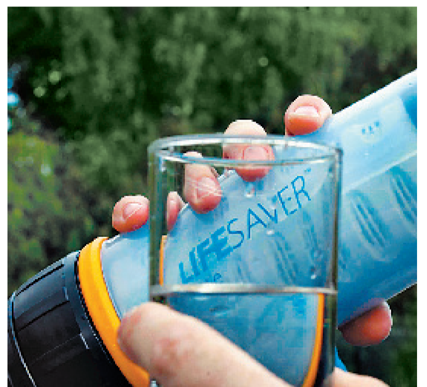
מסנן המים של Life Saver כמעט 100% מהזיהומים נשארים בחוץ