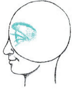
מתכונן על העולם החדש