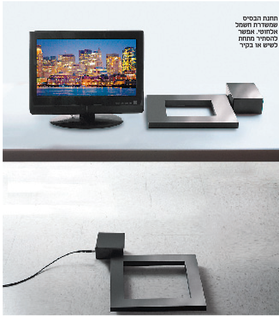
חנות הבסיס שמשרת חשמל אלחוטי. אפשר להסיר מתחת כשש או בקיר