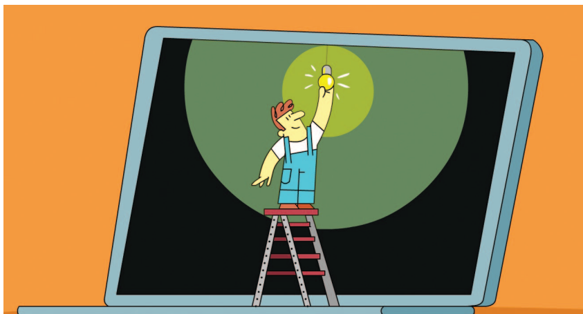
איור: עירן תנדל