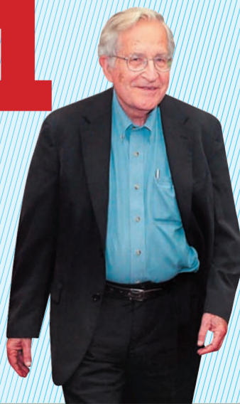
אילוסטרציה: א. פ. מ.