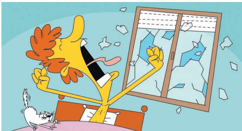
איור: ערד תנדל