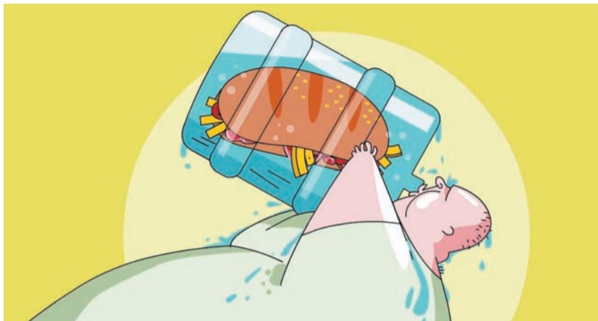
איור: ערן תמנדל