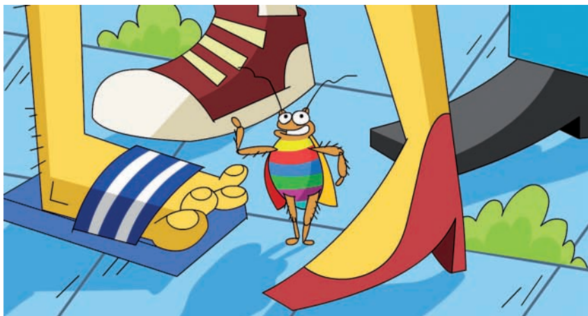
איור: ערן מנדל