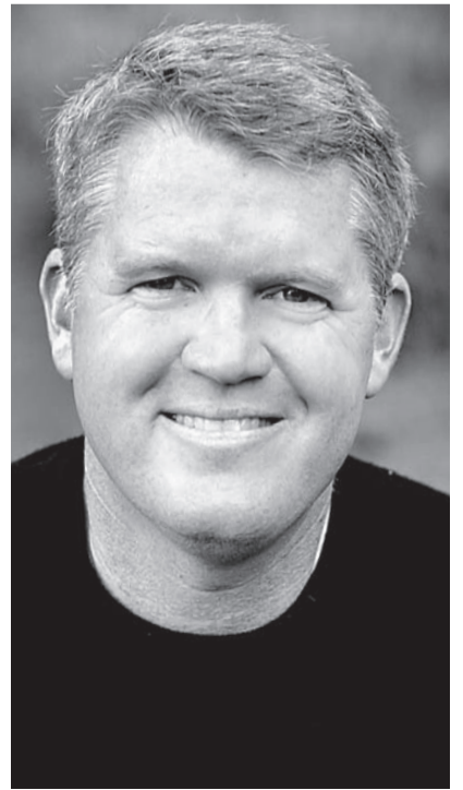
קמפבל יילא להסוות עם אנשים שמאוהבים בעצמם. זו עצה הרבה יותר חשובה מלאהוב את עצמך.

הנרקיסטיסטים הם אנשים עם ביטחון גבוה, היתה משוכנעים שהם יותר טובים מאחרים וקשה להיות בסביבתם. לא פוגשים אותם בקליניקה, יש יותר סיכוי לפגוש אותם במסגרת העבודה, בתור מנכ"לים למשל" –