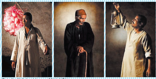
Estudio Al Asbani / masg 2011-0117