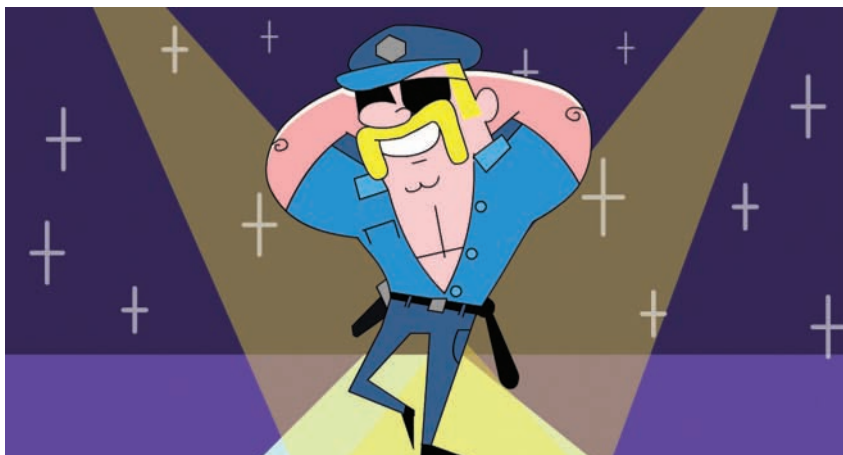
איור: ערן מנדל