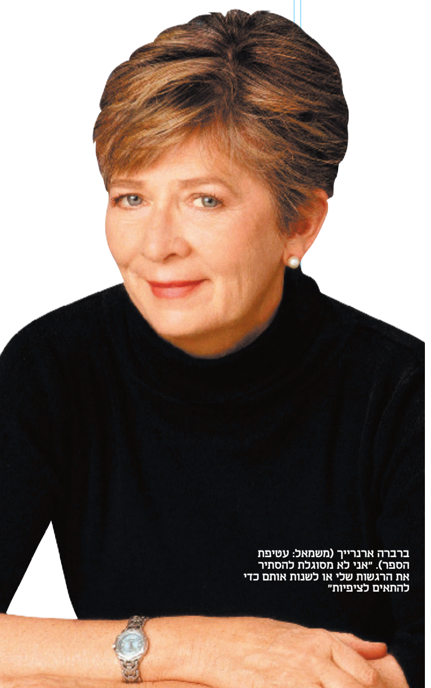
ברברה ארנרייך (תשמאל: עטיפת הספר). אינו לא מסוגלת להסתייג את הרגשות שלי או לטעות אותם כדי להתאים לציפיות"

ארנרייך נשארה מרוכזת ומתוסכלת, ובכל זאת החזיקה לה. "יצאתי ממנה בנאדם הרבה יותר מגעיל", אמרה לאחרונה לג'ון סטיוארט ב"דיילי שוא", וכעת היא מוסיפה: "בזמנו לא ידעתי איזה אפקט יהיה למצב הרוח על ההחלמה שלי. היום יש לנו ראיות ממוחקרים מאוד מקיפים מאוניברסיטת פנסילבניה שמראים שלמצב הרוח אין שום השפעה על ההחלמה מסרטן. אמפירית, פשוט אין לזה שום ראיות".