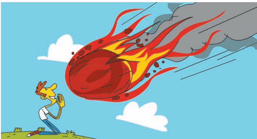
איור: ערד תנדל