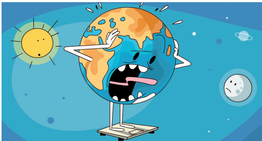
איור: ערן מנדל