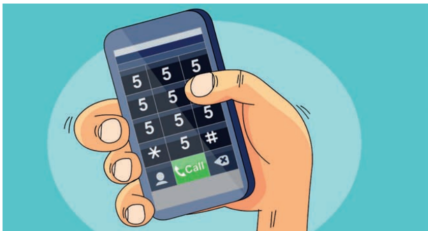
איור: ערן תנדל