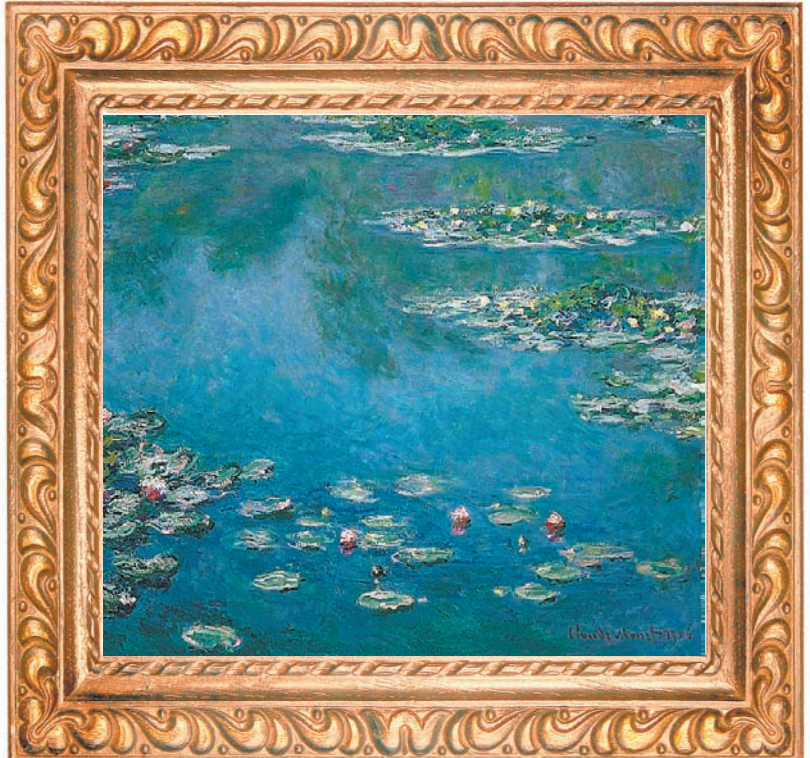
"נחבלות מים" של קלוד מונה. "מרבית האנשים מעדיפים ציורי נוף, והגון הכחול גם הוא העדפה מולדת"

איננו מסוגלים להתעלם ממקורה של יצירת האמנות – האמן – משום שהיצירה מייצגת תקשורת ישירה בין המוח שלנו למוח אנושי אחר, שלוי