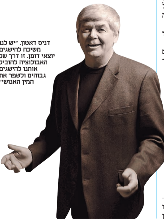
דניס דאטון. "יש לנו משיכה להישגים יצאירי דופן. זו דרך של האבולוציה להוביל אותנו להישגים גבוהים ולשפר את המין האנושי"

אנוש, כדי לשפר את המין שלנו. זה משהו שטבעו בנו. אם הנטייה שלנו היא להימשך לאמנים שאנחנו אוהבים את היצירה שלהם, מה פשר העניין שלנו באמנים מתים?