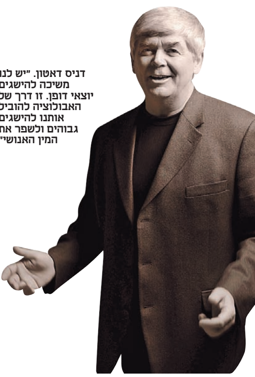
דניס דאטון. "יש לנו משיכה להישגים יוצאי דופן. זו דרך של האבולוציה להוביל אותנו להישגים גבוהים ולשפר את המין האנושי"

"אנתנו בני בניהם של האנשים הכי כשרוניים, מקסימים, שנונים, מעניינים ומושכים בעיני המין השני. החכם או השנון שורד – זה עיקרון דארוויניסטי מובהק"