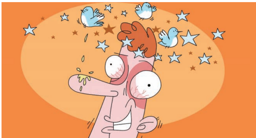
איור: ערן תנוד