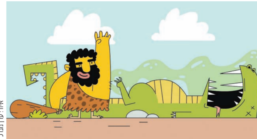
איור: עיר מנדל