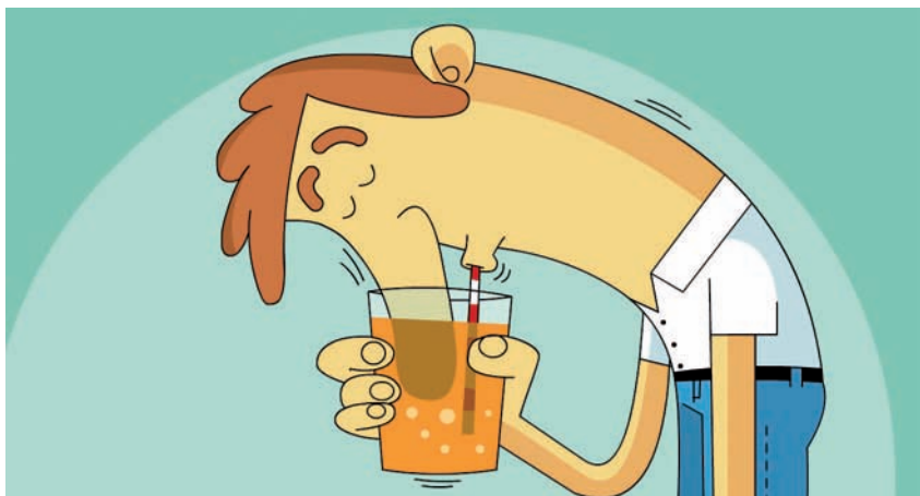
איור: עירן מנדל