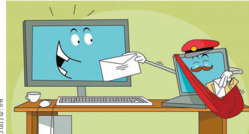
איור: ערן תמיר