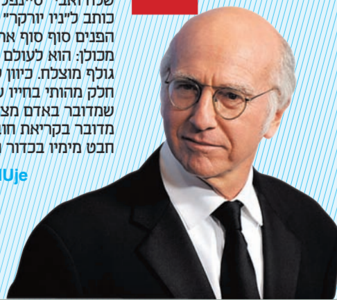
פז נמלודס, את. יום. אר. עיתונות