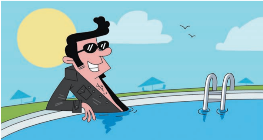
איור: ערן תמנדל