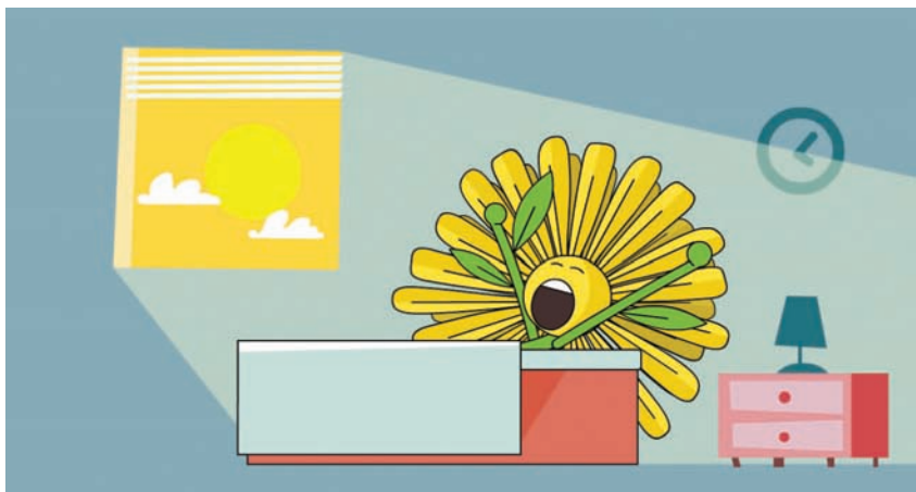
איור: ערן מנדל