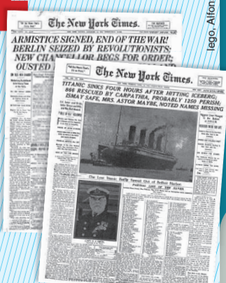
צילומים: Kristopher Mackay, Lego, Alfonso Herranz